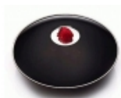
3D hologram Mirage 369,00 Kč

Stylový doplněk pro váš stůl. Vytvořte si 3D hologram z vašeho oblíbeného předmětu. [Popis zboží...]